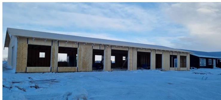
Nýbygging við Gunnarsgerði 5

Viðtalstími Skipulags- og byggingarfulltrúa er: