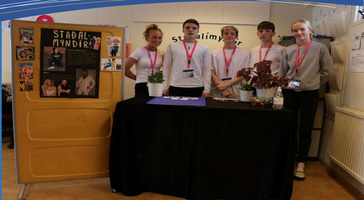
Nemendur í Hvolsskóla