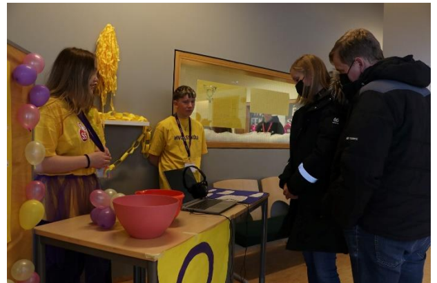
Gestir á þemadögum

Á hverjum vetri hafa verið haldnir þemadagar í Hvolsskóla þar sem að nemendur hella sér út í verkefni af fullum krafti. Árið 2021 var Harry Potter þemað en nú var einblínt á kynjafræði í sinni víðustu mynd. Nemendur unnu verkefni þvert á námsgreinir sem öll áttu það þó sameiginlegt að tengjast kynjafræði með einhverjum hætti. Nemendur útbjuggu kannanir sem lagðar voru fyrir nemendur, kennara og íbúa sveitarfélagsins, gerðu myndbönd til að útskýra betur þann hluta kynjafræðinnar sem viðkomandi hópur var með og settu upp kynningarbása. Miðvikudaginn 16. febrúar var svo komið að því að halda opið hús í skólanum þar sem hver hópur stóð á sínum kynningarbás og lagði góður fjöldi leið sína í skólann ásamt öðrum nemendum og kennurum. Nemendurnir stóðu sig einstaklega vel og básarnir voru listilega settir upp. Það má með sanni segja enn og aftur að framtíð okkar hér í Rangárfingi eystra er björt þegar við sjáum unga fólk í okkar standa svona vel að þeim verkefnum sem þau fá í hendurnar. Dómnefnd var fengin til að meta verkefni og veita viðurkenningar og var þeirra hlutverk ekki öfundsvert.