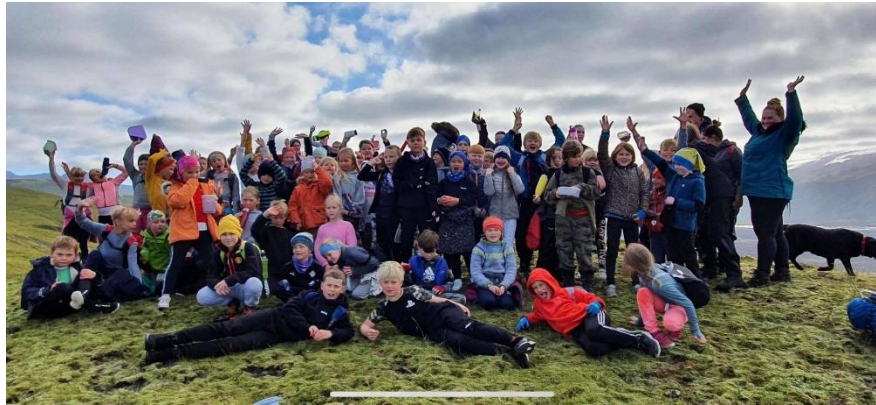
Yngsta stig í árlegri fjallgöngu Hvolsskóla á haustin

Samkvæmt Aðalnámsskrá grunnskóla er Heilbrigði og velferð einn af sex grunnþáttum menntunar. Þátttaka Heilsueflandi grunnskóla styður skóla í að innleiða þennan grunnþátt í öllu sínu starfi. Haustið 2016 sótti Hvolsskóli um þátttöku í þróunarstarfi Heilsueflandi grunnskóla sem Embætti landlæknis og fleiri standa að. Þátttakan er ætluð til þess að styðja grunnskóla í að vinna markvisst að heilsueflingu og skapa skólabrag sem hugar að heilsu og velferð allra nemenda. Markmiðið er að bæta andlega, líkamlega og félagslega heilsu. Í Hvolsskóla starfar stýrihópur sem ber ábyrgð á framvindu verkefnisins og sér einnig um að virkja viðeigandi hagsmunaaðila. Innleiðingafærið er nú á lokametrunum og þegar öllum viðmið um heilsueflandi grunnskóla hafa öðlast virkan sess í starfinu og námskrá skólans öðlast Hvolsskóli rétt til þess að skilgreina sig sem „Heilsueflandi grunnskóli.“