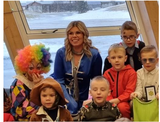
Sveitarstjóri með nemendum úr 2. bekk á Öskudaginn

Undanfarin 2 ár hafa vissulega verið mjög óvenjuleg og ekki hafa skapast mörg tækifæri til að hittast. Hvorki til að skemmta sér né eiga samtál við íbúa og fyrirtæki um málefni líðandi stundar. Því hafa fylgt miklar áskoranir fyrir allt starf, ekki síst í skóla, leikskóla og á hjúkrunar- og dvalarheimilinu Kirkjuholli þar sem grípa hefur þurft til ýmissa aðgerða til að starfið geti gengið frá degi til dags. Allir sem þar hafa lagt sig fram eiga kærar þakkir og hrós skilið. Við horfum nú fram á bjarta tíma og allt útlit fyrir að hjarðónæmi sé að nást sem skapar okkur tækifæri til að endurheimta allt frelsi til samvista. Strax má sjá fjöldann allan af viðburðum auglýsta hér í sveitarfélaginu og er viðbúið að þeir verði vel sóttir. Íslandsmót kvenna í blaki sem haldið var sl. helgi gaf tóninn og var spilað bæði á Hvolsvelli og Hellu. Mikil gleði var við völd og fullt út úr dyrum af þátttakendum og áhorfendum. Öskudagsgleði í Hvolsskóla fór líka fram á Öskudaginn og þar var svo sannarlega mikill metnaður hjá nemendum, kennurum og fyrirtækjum sem buðu uppá alls kyns glaðninga fyrir syngjandi og glaðvær börn og ungmenni. Einnig verður landsmót Samfés