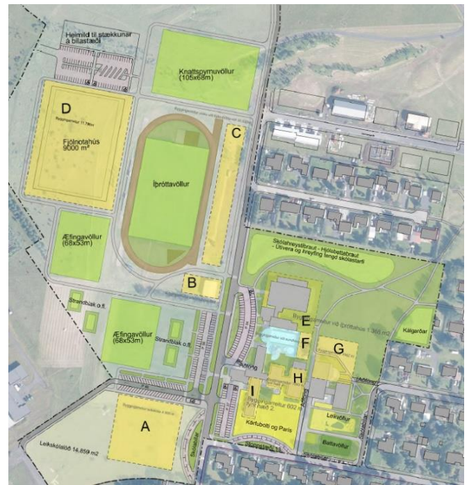
Tillaga að deiliskipulagi skóla- og íþróttasvæðis

Verið er að vinna að nýju deiliskipulagi fyrir skóla- og íþróttasvæðið á Hvolsvelli. Aðalmarkmið skipulagsins er að skilgreina lóð lóðir fyrir íþróttasvæði, skóla og leikskólalastarfsemi. Gert er m.a. ráð fyrir nýjum leikskóla sem mun verða staðsettur við Vallarbraut. Einnig er í skipulaginu gert ráð fyrir stækkun á grunnskóla, íþróttahúsi og sundlaugarsvæði ásamt byggingarreit fyrir fjölnota íþróttahús. Íþróttasvæðið er auk þess endurskipulagt með nýjum æfingavöllum. Á myndinni hér hægra megin sést tillagan eins og hún lítur út í dag.