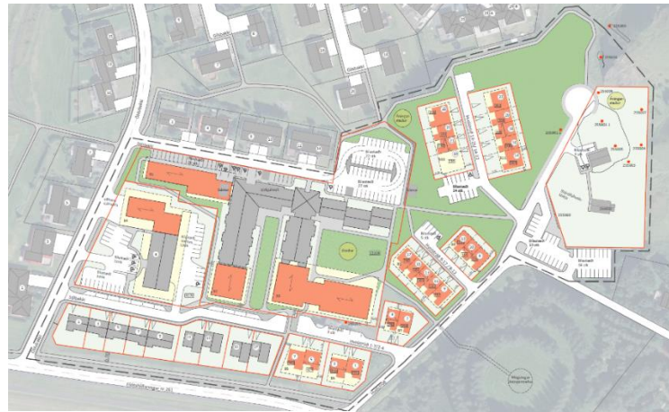
Nýtt deiliskipulag við Kirkjuhvolsreit

Nú nýlega var auglýst tillaga að breytingu á deiliskipulagi á Kirkjuhvolsreit á Hvolsvelli. Breytingin felst í því að gert er ráð fyrir þremur nýjum viðbyggingum við dvalarheimilið sem og að núverandi bílastæði verða stækkuð. Skipulagið gerir ráð fyrir byggingu rað- og parhúsa með 23 íbúðum ætluðum fyrir 60 ára og eldri. Við heilsugæsluna er gert ráð fyrir nýrri aðkomu fyrir sjúkrabíla auk stækkunar á stöðinni sjálfri. Einnig nær skipulagið til lóðar Stórólfshvolskirkju þar sem gert er ráð fyrir nýjum bílastæðum